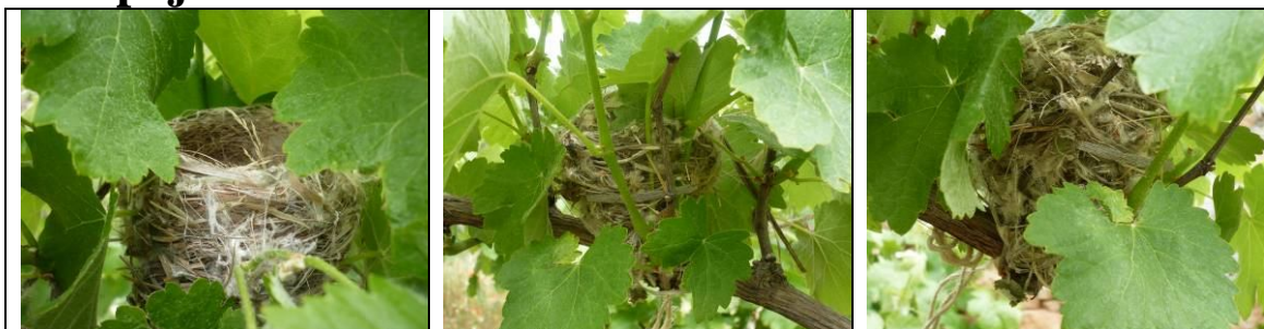
Parra que sirve de cobijo a un nido de pájaros.

“Lo adecuado era hallar un “sitio” en el suelo donde pudiera sentarme sin fatiga. Un “sitio” significa un lugar donde uno podía sentirse feliz y fuerte de manera natural.